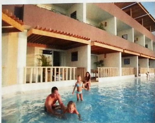
OASIS DE LUJO. Con salida directa a la piscina, las habitaciones del Aranwa Resort & Spa ofrecen diversión en familia.

Una irresistible vista frente al mar nos levanta de la cama. El cielo despejado nos anuncia la travesía del día. Turistas y locales esperan en el muelle de la bahía de Paracas para comenzar el circuito hacia las Islas Ballestas. Son 22 islas e islotes y 11 puntas guaneras las que forman parte de la reserva natural administrada por el Servicio Nacional de Áreas Naturales Protegidas por el Estado (Sernanp). Esta riqueza de la corriente fría de Humboldt es la misma que permite el surgimiento de la fauna marina. Hábitat privile-