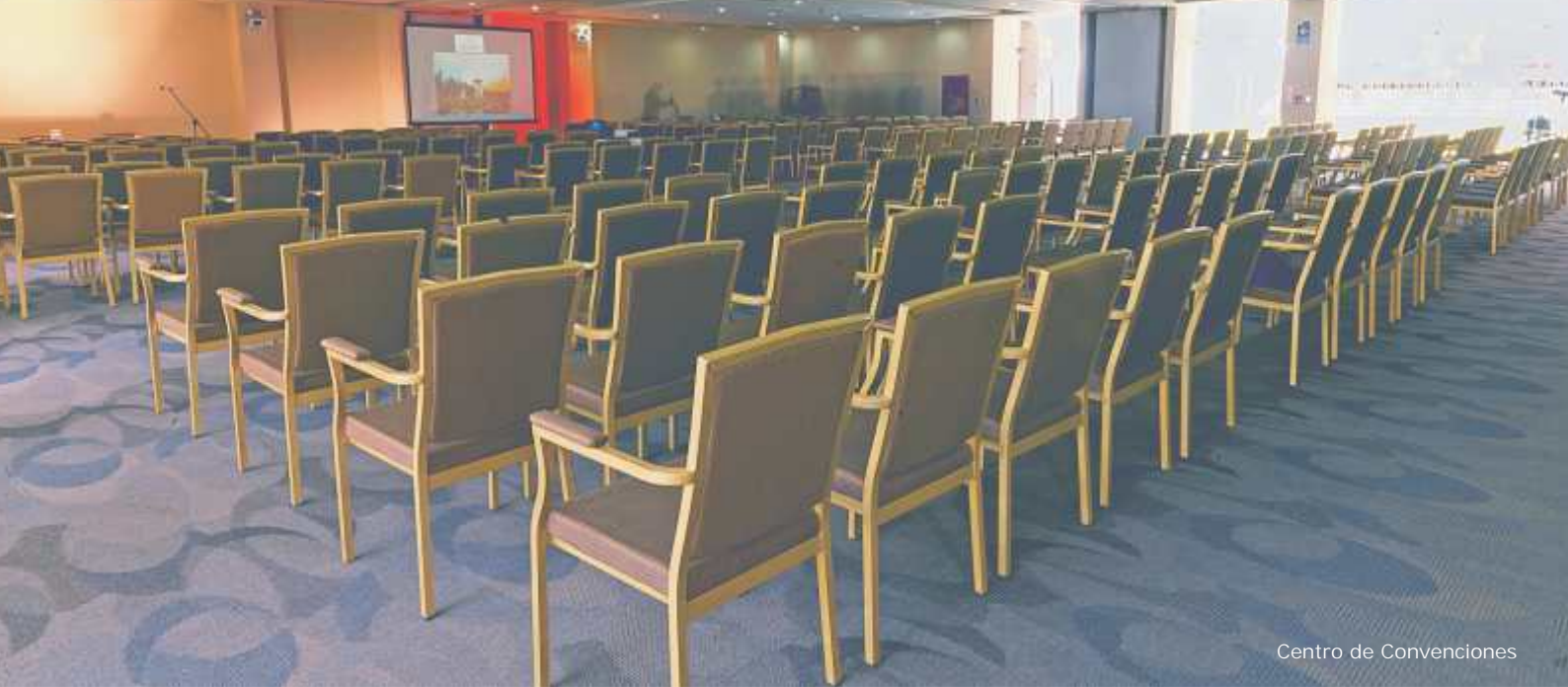
Centro de Convenciones